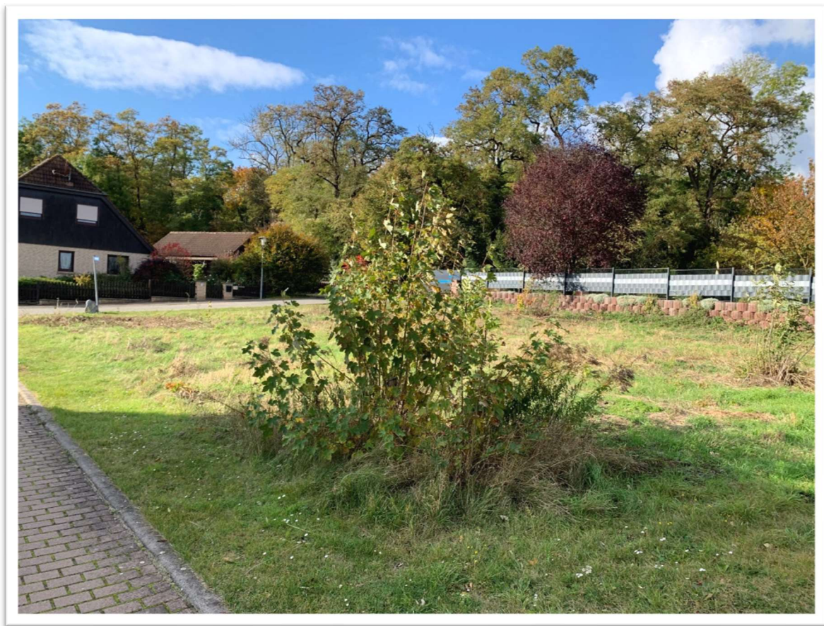
Blick Richtung Nord-Ost

Das Grundstück befindet sich in der Gemeinde Bottmersdorf südlich der Stadt Wanzleben-Börde. Das Grundstück liegt unmittelbar südlich des kleinen Mischwaldes am Henneberg und Osterberg in einer ruhigen und kleinen Einfamilienhaussiedlung. Die Landeshauptstadt Magdeburg ist nur ca. 15 km entfernt und in wenigen Autofahrminuten über die Bundesstraße 180 zu erreichen. Der Autobahn-Anschluss Wanzleben (A 14) ist ca. 12 km von der Gemeinde entfernt. Der nahegelegene Bahnhof Blumenberg liegt an der Bahnstrecke Magdeburg–Halberstadt.